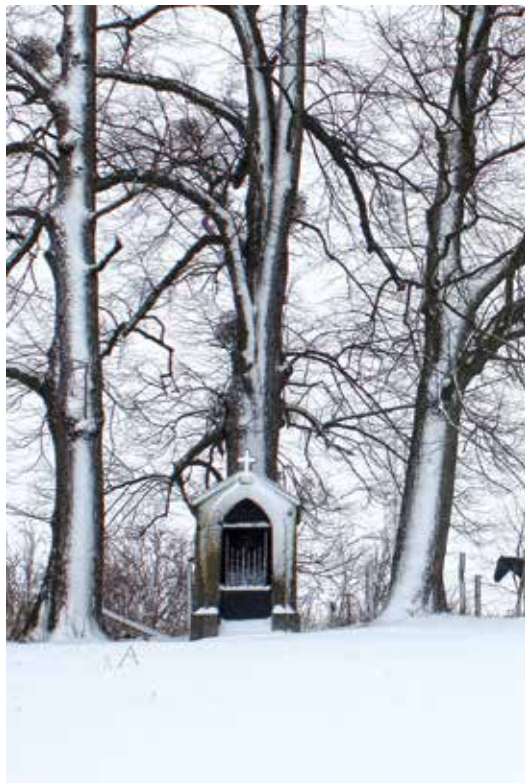
Ci-contre, la chapelle en hiver.

Nous proposons de continuer à tracer cette promenade dans la prochaine édition où nous nous attarderons sur l'histoire du château de Neufcour et de son domaine dont dépendait la ferme Sainte-Anne. Peut-être cette belle endormie pourra-t-elle revivre et connaître une nouvelle histoire ?