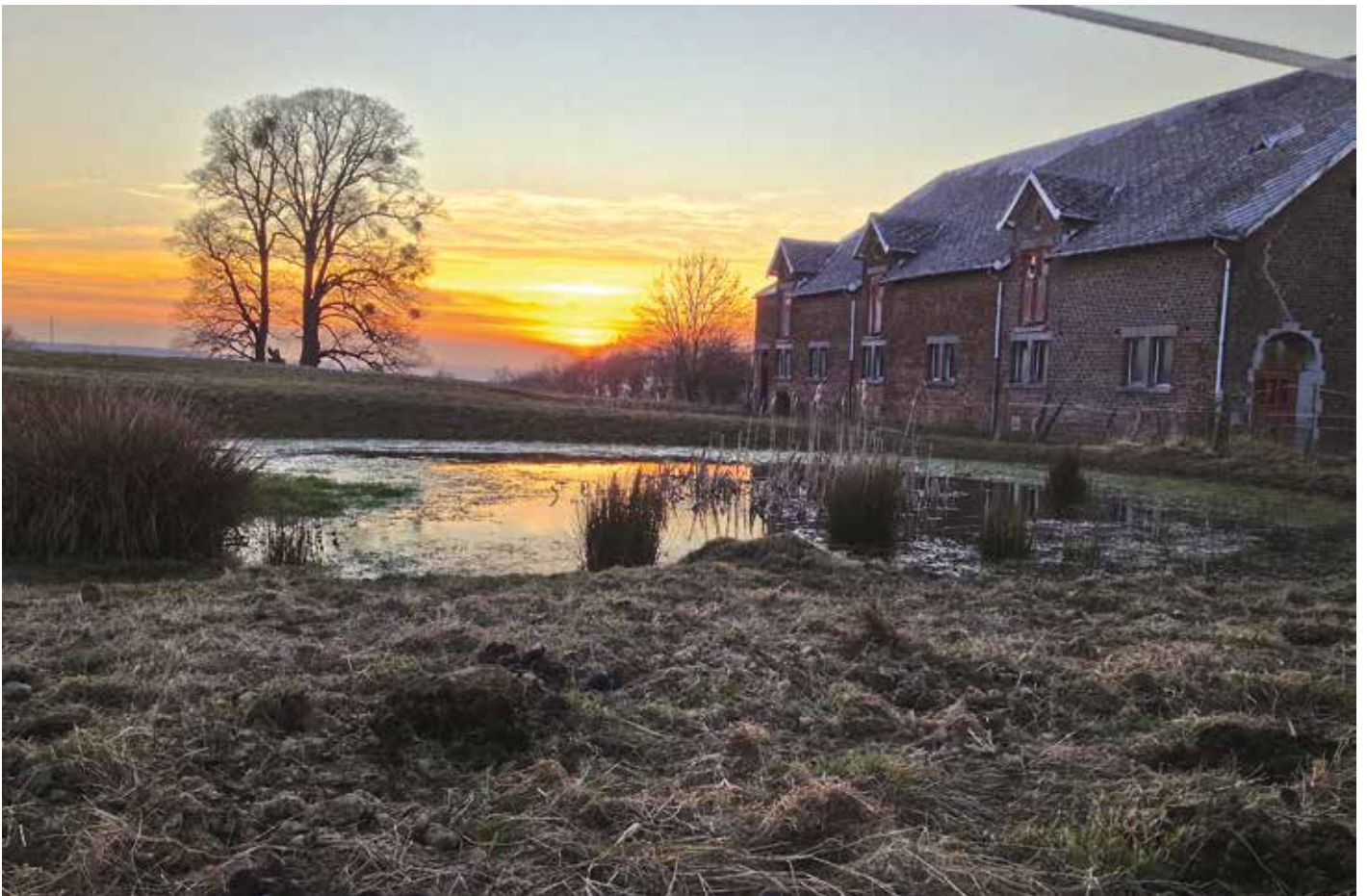
À droite dans la photo, la Ferme Sainte-Anne.