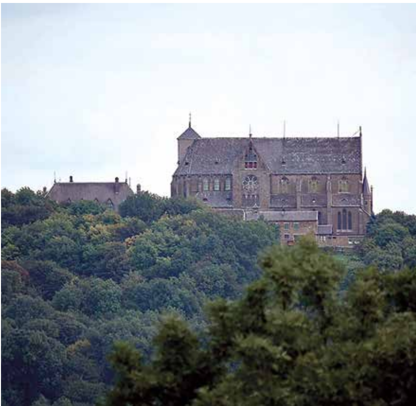
Vue sur la basilique de Chèvremont.

De retour au croisement et comme la montée est rude, on s'assied quelques minutes à une table conviviale et on commence à deviner que le paysage va s'élargir. Droit devant, le regard ne peut qu'être attiré par la basilique Notre Dame de Chèvremont située au sommet de la colline du même nom.